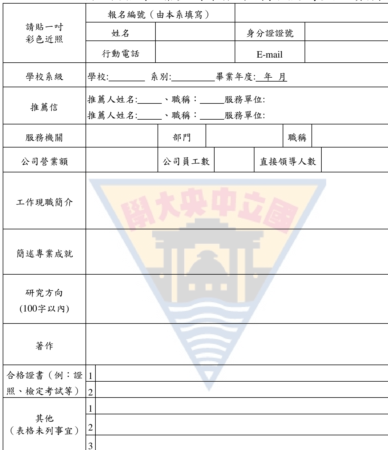
國立中央大學企業管理學系碩士在職專班招生考生個人資料表