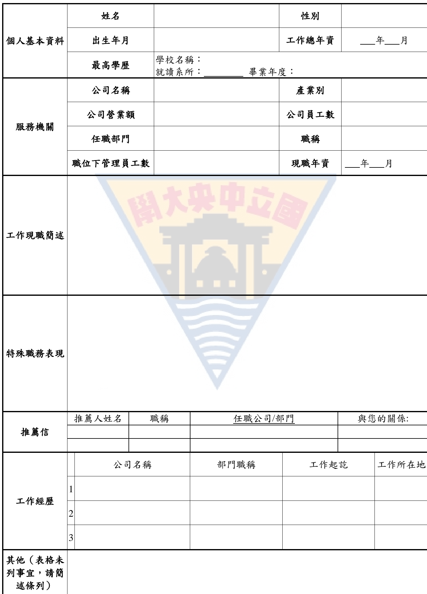
國立中央大學人力資源管理研究所 碩士在職專班入學考試 個人資料表