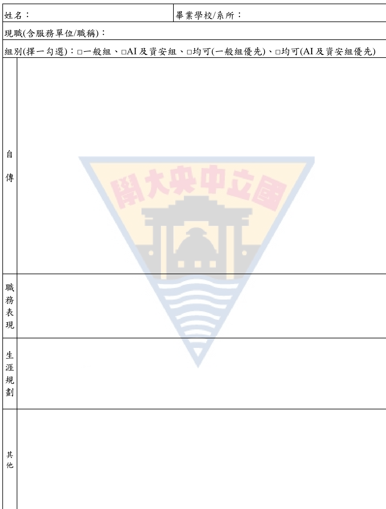
(表六) 國立中央大學114學年度資管系碩士在職專班入學考試自我簡介表

※本班依授課內容分兩組：一般組與 AI 及資安組，錄取通知將明列入學後組別，不可轉組。修業規定請至本系網頁查詢。