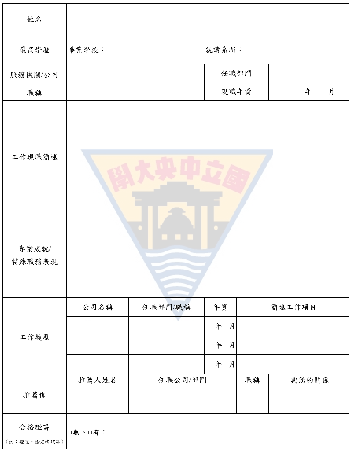
(表二) 國立中央大學土木工程學系碩士在職專班招生考生個人資料表

申請者必須根據本表格格式與要求，據實提供相關資料，以便審查委員客觀瞭解申請者學經歷與相關成果；資料如有不實，經核實，將追究相關責任。表格之相關欄位數請自行增列。